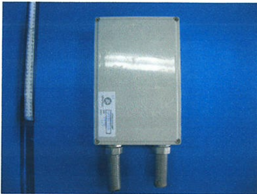
IP Test Sample